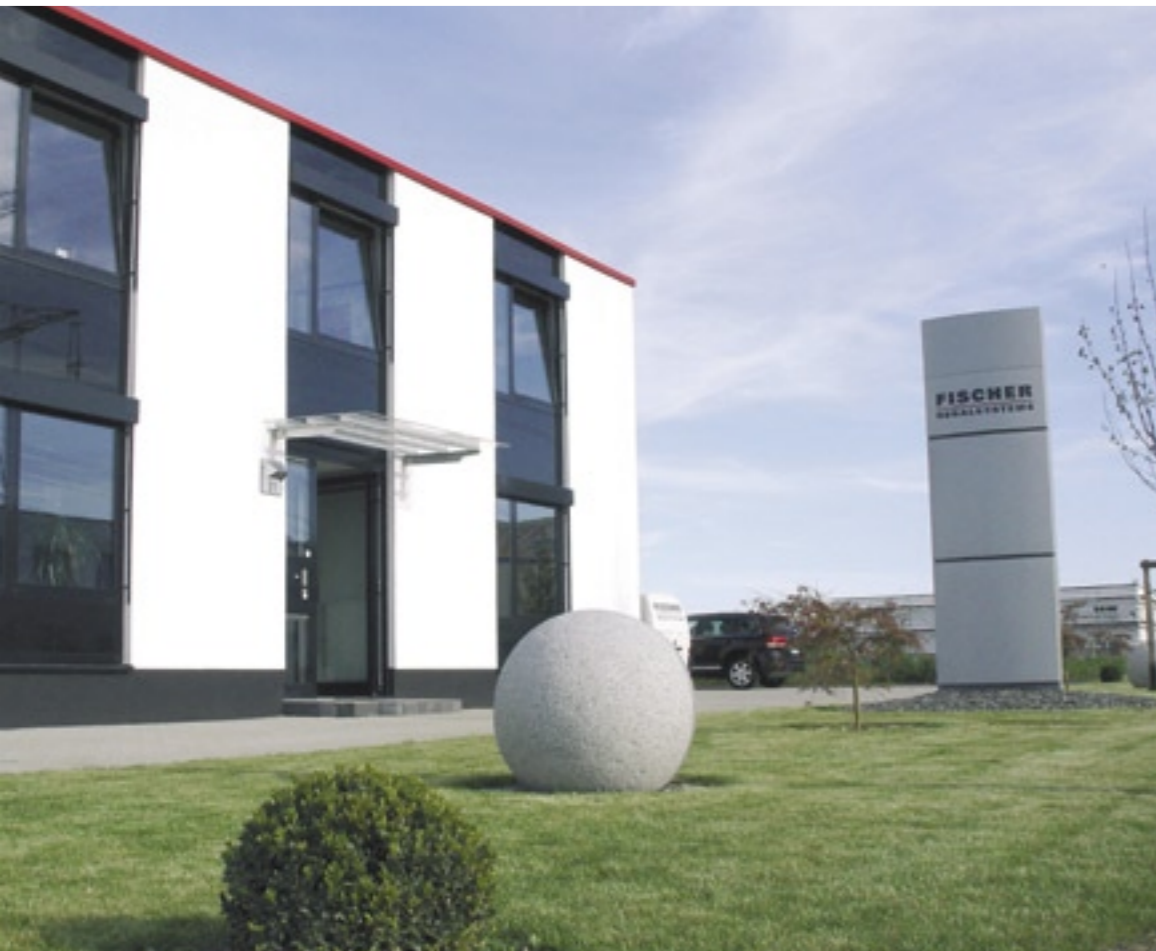
...Fischer Regalsysteme mit Sitz in Bornheim

ierlich, Regalkapazitäten können oft nicht mehr ausgeweitet werden. Viele Unternehmen suchen daher nach Möglichkeiten, diese Aufgaben auf effiziente und kostengünstige Weise zu bewältigen. Das Zauberwort heißt Outsourcing. Und auch darauf hat man sich bei Fischer eingestellt und bietet maßgeschneiderte Konzepte für die unterschiedlichsten Archivierungsanforderungen. In dem hervorragend ausgestatteten Logistikzentrum in Bornheim können individuelle Archive eingerichtet werden, um die Akten entsprechend ihren Aufbewahrungsvorschriften zu