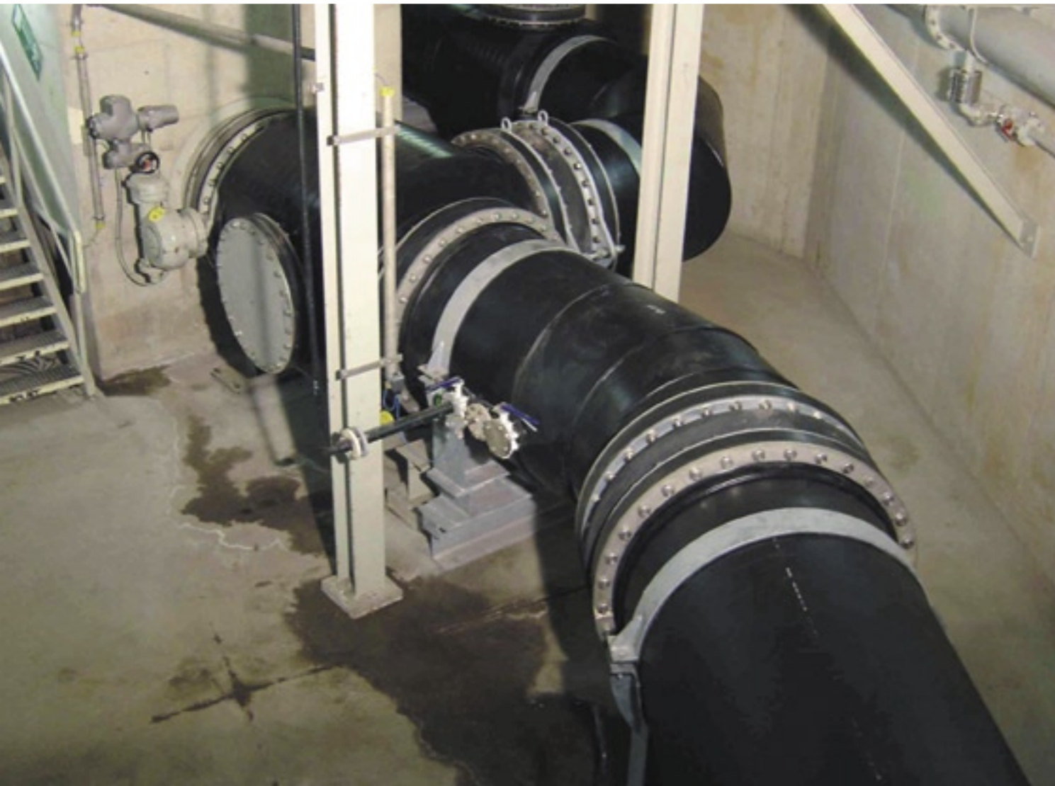
Sicherheit und Qualität – dafür steht die Kubatec Kunststoffbautechnik GmbH & Co. KG, hier ein Beispiel für den Rohrleitungsbau

die Tätigkeit bei einem Montageunternehmen Gelegenheit, vielfältige Erfahrungen zu sammeln. Nach der Meisterprüfung wagte er den Schritt in die Selbstständigkeit. Zunächst nebenberuflich verlegte der junge Handwerksmeister Rohrleitungen